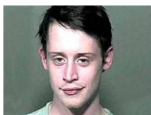
Главный герой культового фильма «Один дома» Макколейн Калкин лечится от наркотической зависимости...

И ПРИ ЭТОМ КАЖДЫЙ, КТО ПЕРВЫЙ РАЗ ПРОБОВАЛ НАРКОТИКИ, БЫЛ УВЕРЕН, ЧТО СМОЖЕТ ВОВРЕМЯ ОСТАНОВИТЬСЯ. НУ, И ГДЕ ОН СЕЙЧАС???