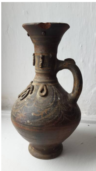
Кувшин начала 20 века. Раздел ЭТНОГРАФИИ. Дагестан.