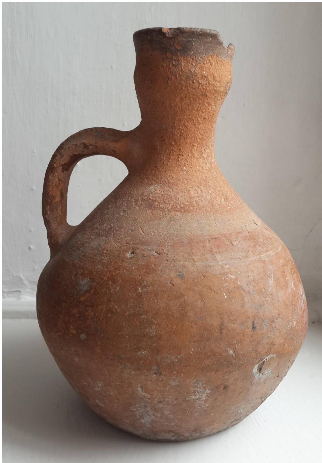
Кувшин 1862года. Раздел ЭТНОГРАФИИ. Дагестан.